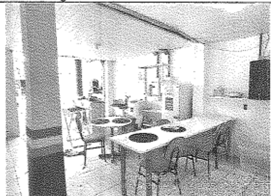
Imagem 12: Espaço para refeitório