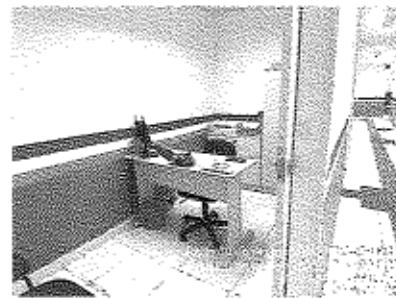
Imagem 02: Sala