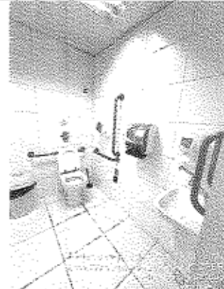
Imagem 08: Banheiro PNE