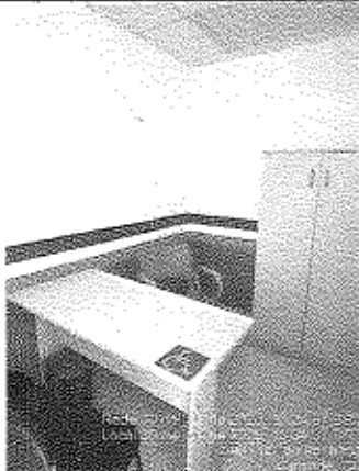
Imagem 09: Sala