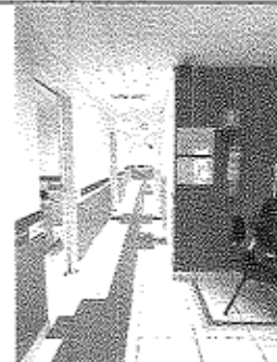
Imagem 04: Área de circulação