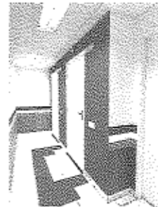
Imagem 06: Área de circulação (Acesso para os banheiros PNE)