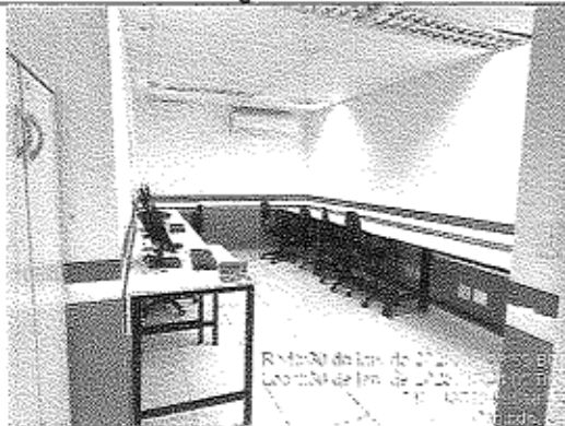
Imagem 11: Sala