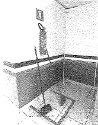
Imagem 07: Indicação e instalação do projeto de prevenção e combate a incêndio