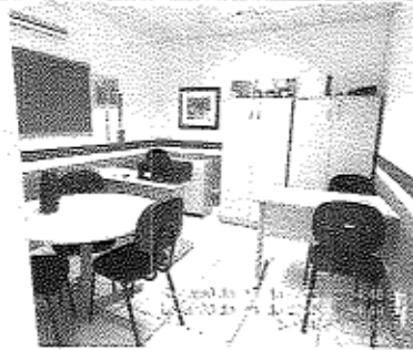
Imagem 05: Sala para reuniões