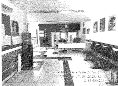
Imagem 03: Recepção